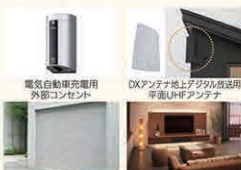
電気自動車充電用 外部コンセント