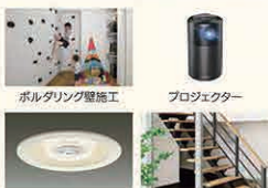
ボルトリング壁施工