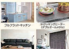
フルフラットキッチン