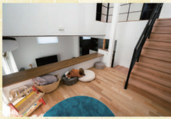
■スキップフロアのファミリースペース